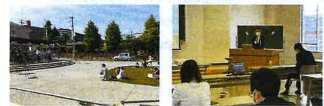
なとポップの様子

名取市商工会及び名取市企業連絡協議会では、会員事業所の企業発展に繋がる事業を引き続き実施して参ります。