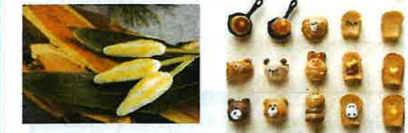
◀本物の竹串と笹かまほこを使ったグッズ▶ ▶本物のパン生地を使ったパングッズ▶ GuuRe. 8 E-mail: guurehatti@yahoo.co.jp TEL: 090-7937-6947

商品は基本委託販売のみで、不定期開催のマルシェでも販売を行っていますので、一度「GuuRe. 8」でSNSをチェックしてみてください。